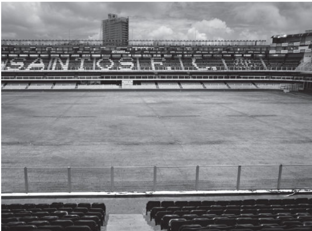
Vila Belmiro, uma catedral com seus próprios fiéis

Da sala de imprensa, saíam perguntas para Neymar. Ele se animou, participou do jogo e respondeu o melhor que pôde.