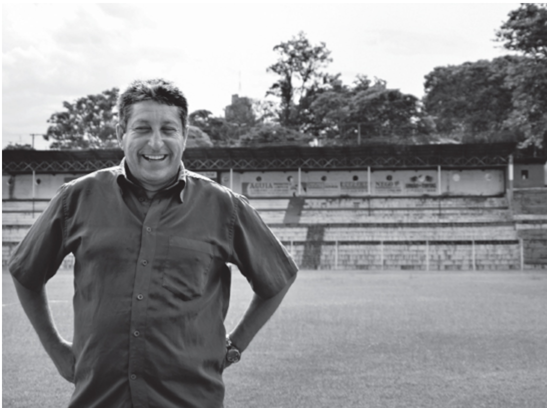
Reginaldo Fino no CT Neymar

– Aqui, na região de Ourinhos, trabalhar no futebol é um pouco mais difícil do que em Santos. Neymar era muito pobre e não tinha possibilidade de ir sozinho treinar. É comum entre os treinadores de Santos buscar ajuda de patrocinadores ou pessoas que invistam no futebol. Esse ambiente não existe aqui. Neymar e a irmã conseguiram uma bolsa em um dos melhores colégios de Santos, transporte para ir e voltar para a casa, alimentação, uniforme e livros. Ele teve ajuda de muita gente na cidade. Se você pega um garoto pobre de Ourinhos que joga futebol bem, não tem ninguém que o ajude nem o patrocine. E, se os pais não tiverem dinheiro, ele não poderá jogar futebol. Todos ajudaram o Robinho, e ele era ainda mais pobre do que o Neymar. E eles chegaram onde estão depois de ter conseguido ajuda de muita gente – diz Fino.