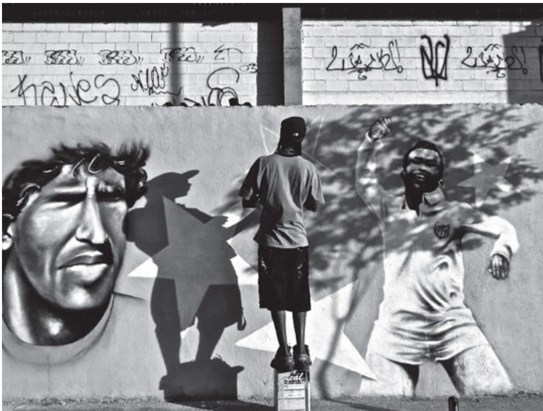
O grafiteiro Duim pintando Zico e Pelé no Rio de Janeiro

Mas, mas, mas... A fórmula de Dunga se mostrava tão eficaz quanto a fórmula de Carlos Alberto Parreira em 2006. E funcionou tão mal quanto. O ritmo até que ficou razoável no caminho, mas tudo acabou com outra derrota nas quartas de final, dessa vez para a Holanda.