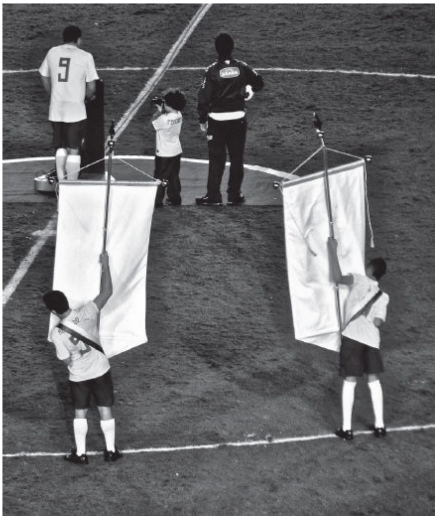
Ronaldo se despede

– Só quero a bola no pé... – disse Ronaldo antes do jogo, com um grande sorriso e certa ironia.